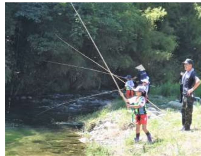
きれいな阿井川にすむ いきものたち