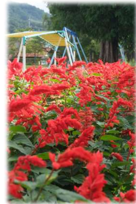
初秋に咲く人権の花「サルビア」

11月13日(土) あいっこの集い 軽スポーツを楽しむイベント (阿井地区福祉振興協議会青少年育成委員会)